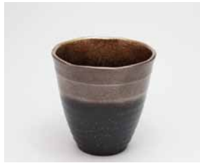
YM-012 銀河(小) 直径8.8cm×高さ8.9cm