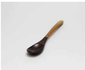
YX-031 スプーン竹 銀梨子地 長さ12.5cm