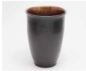
YM-015 銀河 樺(大) 直径7.9cm×高さ11.0cm