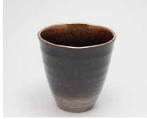
YT-011 夜空(小) 直径8.8cm×高さ8.9cm