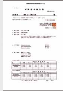
京都微生物研究所 抗菌試験結果報告書

衛生面で食中毒の原因となる大腸菌、黄色ブドウ球菌、サルモネラ菌、腸炎ビブリオ菌が24時間後検出されない事と、虫歯菌も検出されなかった事が証明されました。