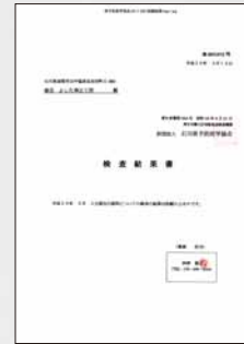
石川県予防医学協会 検査結果書