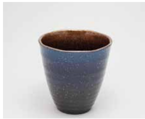
YT-013 スカイブルー(小) 直径8.8cm×高さ8.9cm