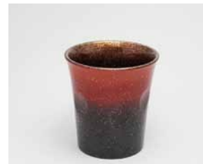
YX-021 フリーカップ スカイレッド 樺 直径7.7cm×高さ8.1cm