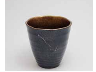
YX-003 北斗七星(小) 直径8.8cm×高さ8.9cm