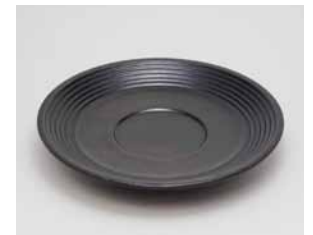
YX-030 フリーカップ用 皿栓 直径15.0cm×高さ2.0cm