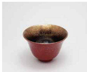
YX-012 盃 銀河 百合 朱 直径8.0cm×高さ5.2cm