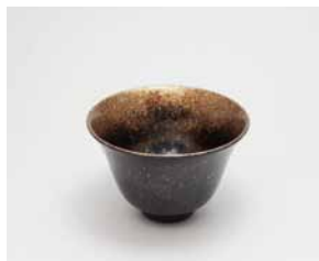
YX-011 盃 銀河 百合 黒 直径8.0cm×高さ5.2cm