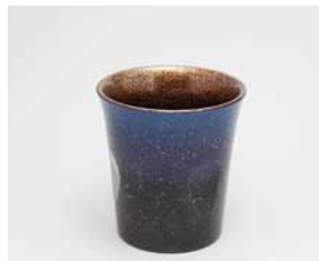
YX-020 フリーカップ スカイブルー 樺 直径7.7cm×高さ8.1cm