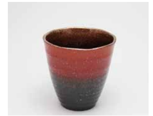
YT-017 スカイレッド(小) 直径8.8cm×高さ8.9cm