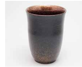
YM-021 根来銀 樺(大)黒 直径7.9cm×高さ11.0cm