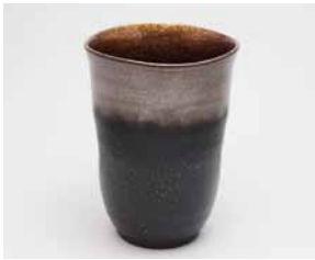
YX-001 銀河(大) 直径8.0cm×高さ11.0cm