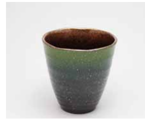
YT-015 スカイグリーン(小) 直径8.8cm×高さ8.9cm