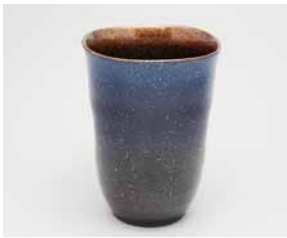
YT-012 スカイブルー(大) 直径8.0cm×高さ11.0cm