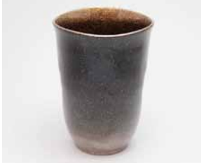
YT-010 夜空(大) 直径8.0cm×高さ11.0cm