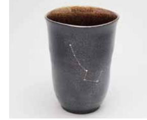
YM-010 北斗七星(大) 直径8.0cm×高さ11.0cm