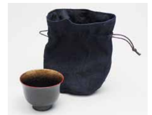
YM-017 盃 樺 布袋入り 直径6.2cm×高さ4.7cm