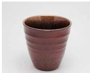
YM-020 根来銀 樺(小)朱 直径8.9cm×高さ8.9cm