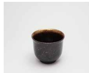
YX-013 盃 銀河 端反 黒 直径5.8cm×高さ4.9cm