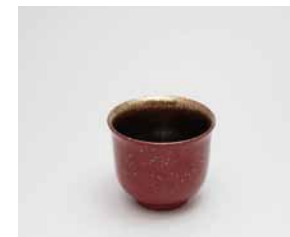
YX-014 盃 銀河 端反 朱 直径5.8cm×高さ4.9cm