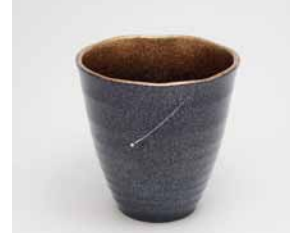
YX-002 彗星(小) 直径8.8cm×高さ8.9cm