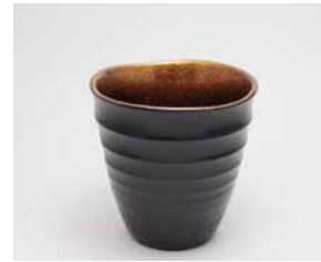
YM-016 銀河 樺(小) 直径8.9cm×高さ8.9cm