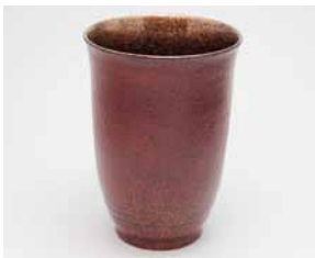
YM-018 根来銀 樺(大)朱 直径7.9cm×高さ11.0cm