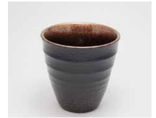
YM-019 根来銀 樺(小)黒 直径8.9cm×高さ8.9cm