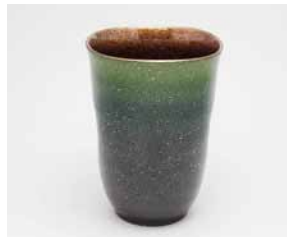
YT-014 スカイグリーン(大) 直径8.0cm×高さ11.0cm