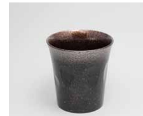
YX-022 フリーカップ 夜空 樺 直径7.7cm×高さ8.1cm