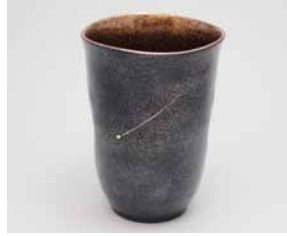
YM-011 彗星(大) 直径8.0cm×高さ11.0cm