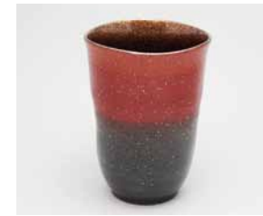
YT-016 スカイレッド(大) 直径8.0cm×高さ11.0cm